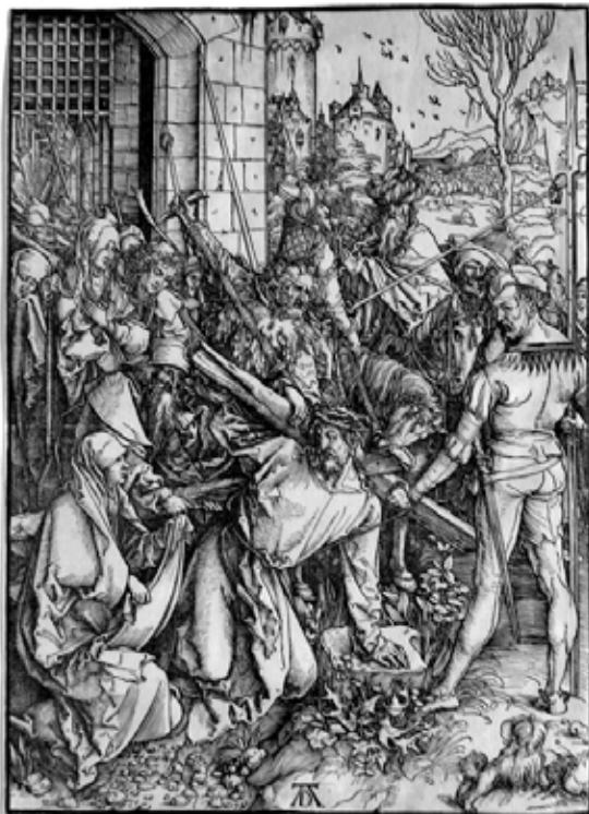
Albrecht Dürer, Kreuztragung

unterschiedlichsten Formen in ganz Europa bekannt. Im 15./16. Jahrhundert gibt Italien den Ton an und im 17. Jahrhundert erreichen die Motetten von Giovanni Gabrieli und Claudio Monteverdi in Venedig einen künstlerischen Höhepunkt. Heinrich Schütz hält sich von 1609 bis 1612 als Schüler von Gabrieli in Venedig auf, und begegnet auf einer 2. Reise 1628/29 auch dort Monteverdi. Der bei Gabrieli gelernte Motettenstil bleibt zeitlebens Schütz' Inspirationsquelle.